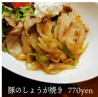
豚のしょうが焼き 770yen