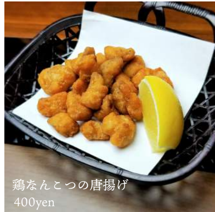
鶏なんこつの唐揚げ 400yen