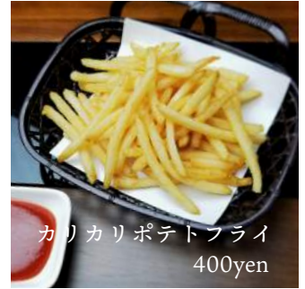
カリカリポテトフライ 400yen