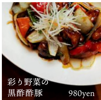
彩り野菜の 黒酢酢豚 980yen