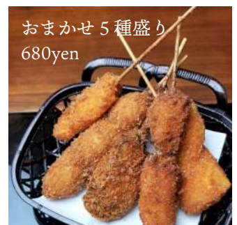
おまかせ 5 種盛り 680yen