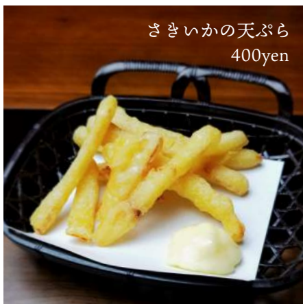
さきいかの天ぷら 400yen