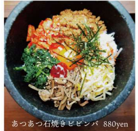
あつあつ石焼きビビンバ 880yen