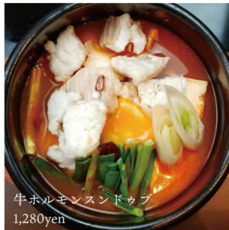
牛ホルモン スンドゥブ 1,280yen