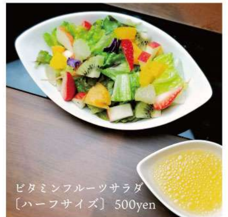
ビタミンフルーツサラダ [ハーフサイズ] 500yen