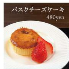
バスクチーズケーキ 480yen