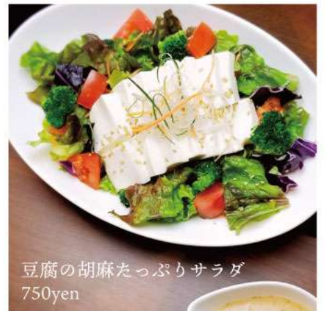
豆腐の胡麻たっぷりサラダ 750yen