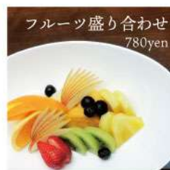
フルーツ盛り合わせ 780yen