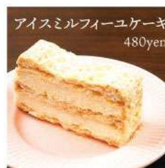
アイスマルフィーユケーキ 480yen