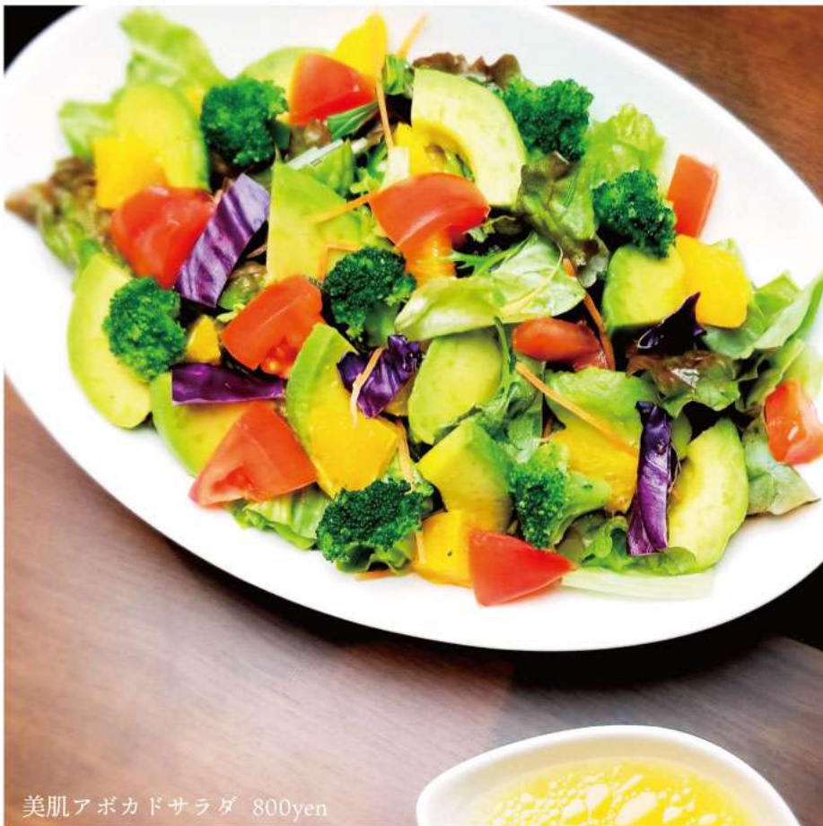
美肌アボカドサラダ 800yen