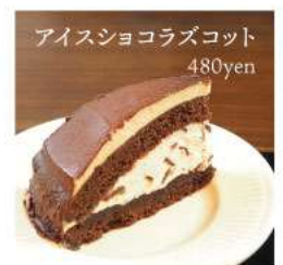
アイスショコラズコット 480yen