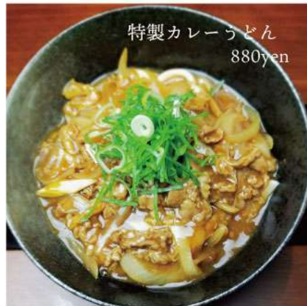
特製カレーうどん 880yen