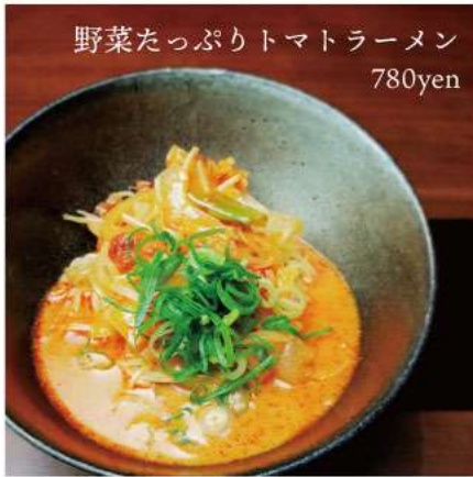
野菜たっぷりトマトラーメン 780yen