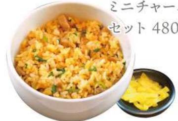
ミニチャーハン セット 480yen