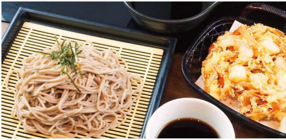
エビ&イカ入 サクサクジャンボかき揚げ天ざるそば 880yen