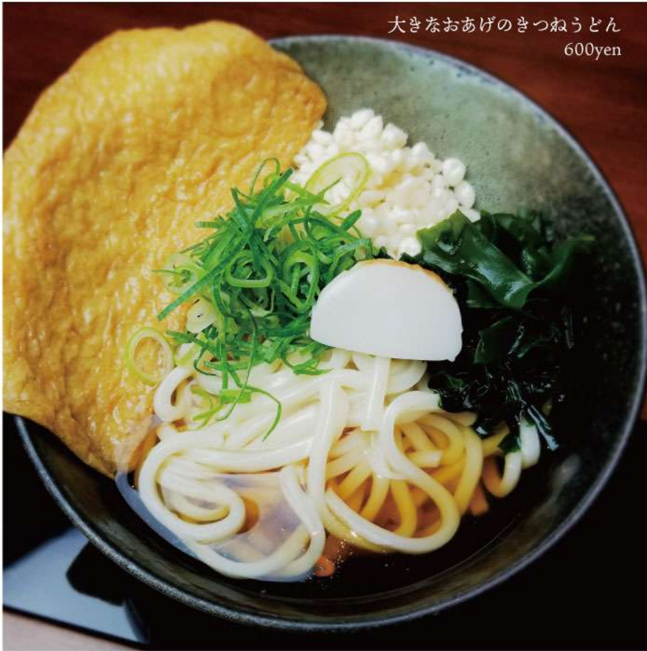
大きなおあげのきつねうどん 600yen