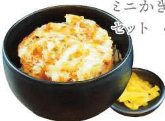
ミニかき揚げ丼 セット 480yen