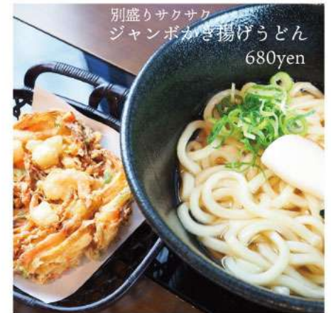
別盛りサクサク ジャンボかき揚げうどん 680yen