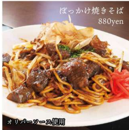
ぼっかけ焼きそば 880yen