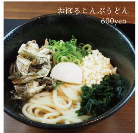
おぼろこんぶうどん 600yen