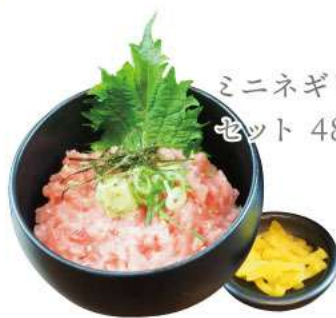
ミニネギトロ丼 セット 480yen